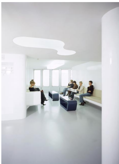
Empfang / Warten