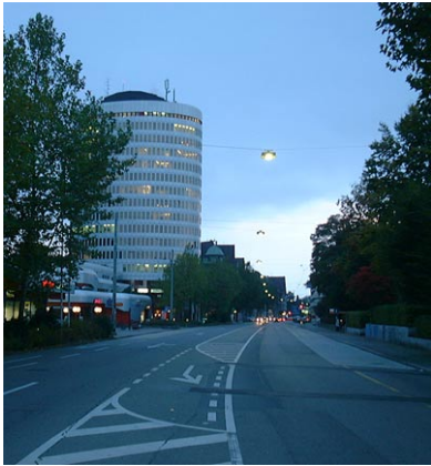
Silberturm / Grossacker in St.Gallen