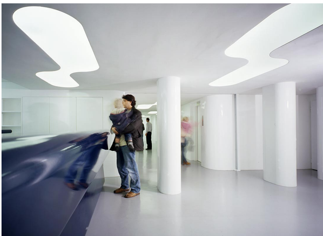
Empfang / Desk